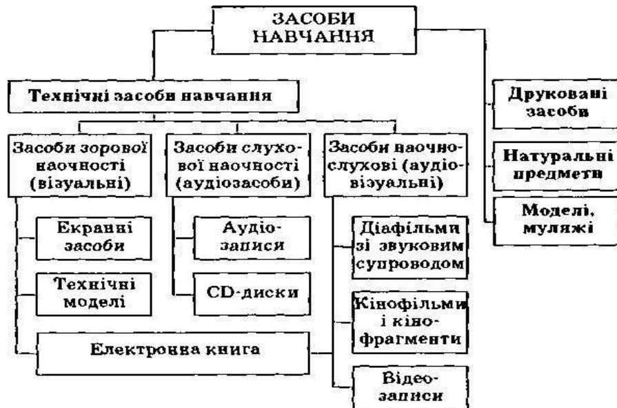
Рис.1 Види засобів навчання

Транспарант є екранним засобом зорової наочності, ефективний завдяки своїм високим демонстраційним властивостям: фронтальності, контрастності, яскравості тощо. Інформацію з екрана учні розглядають емоційно, що сприяє зосередженню їх уваги на об'єктах вивчення, а це важливо для інтенсифікації, підвищення ефективності навчального процесу.